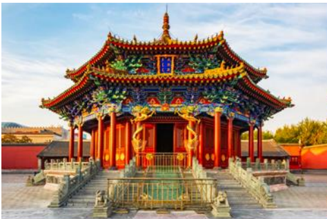
พระราชวังโบราณเสิ่นหยาง