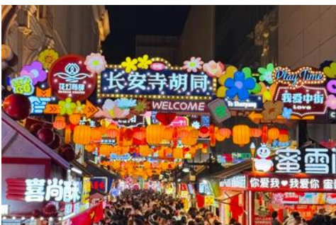
ถนนคนเดินจวงเจีย