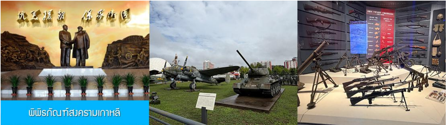
พิพิธภัณฑ์สงครามเกาหลี