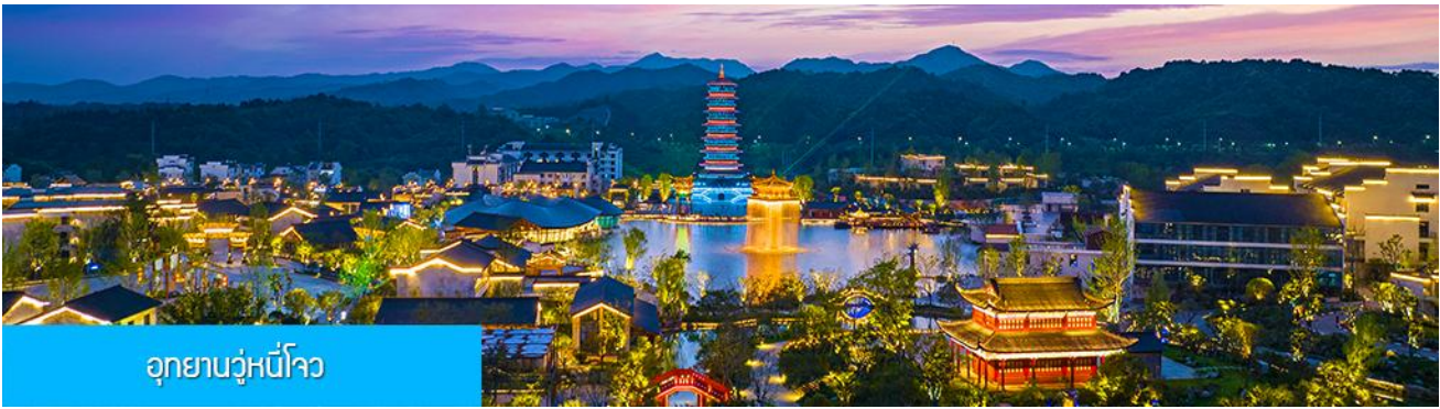
อุทยานจู่หนี่โจว

หลังอาหารนำท่านนั่งกระเช้าลงจากหมู่บ้านหวงหลิ่ง นำท่านขึ้นรถบัสเดินทางสู่อุทยานจู่หนี่โจว