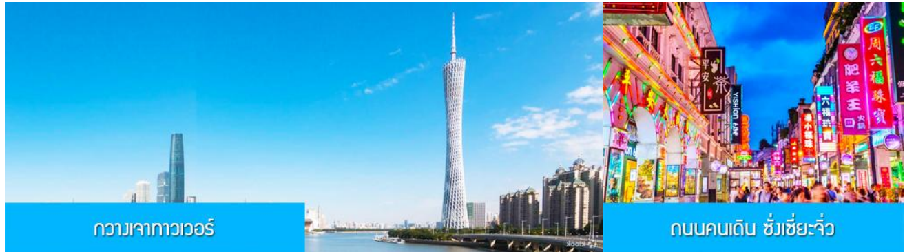
กวางเจาทาวเวอร์