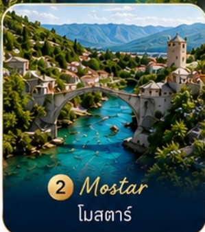
2 Mostar โมสตาร์