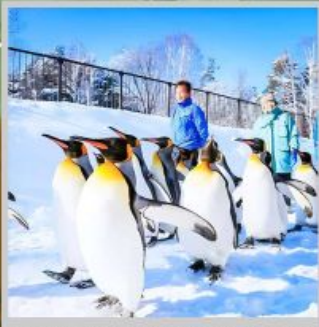
"PENGUIN ASAHIYAMA ZOO"