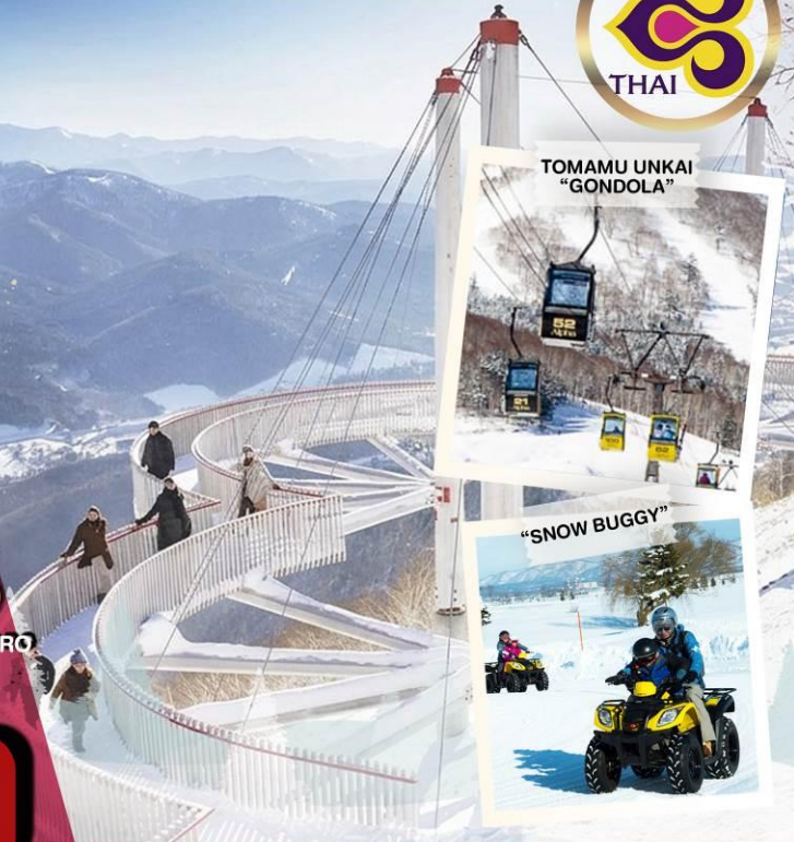
TOMAMU UNKAI “GONDOLA”