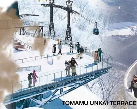
TOMAMU UNKAI TERRACE