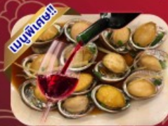
ซีฟู้ด เป้าอ้อะไอน์แดง