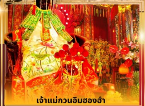
เจ้าแม่กวนอิมสองอ่า

ช้อปปิ้งบนคนเดินตงเหมิน เมืองโบราณหนานโกว วัดกวนอู ร้านหนังสือจงซูเก้อ ถ่ายรูปหน้าตึกฟิงอัน เจ้าแม่กวนอิมสองอ่า วัดหวังต้าเซียน วัดแชกงหมิว ช้อปปิ้งย่านจิมซาจุ้ย นองปิง 360 สักการะวัดพระใหญ่โป่หลิน ช้อปปิ้งซีตี้เกทเอาท์เล็ต