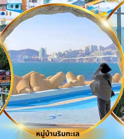
หมู่บ้านริมทะเล