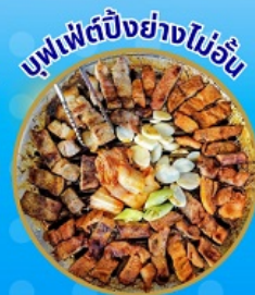
บุฟเฟ่ต์ปิ้งย่างไม่อั้น