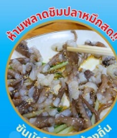
ห้ามพลาดชิมปลาหมึกสด!! ชั้นนักกีฬาอาหารท้องถิ่น

ถ่ายรูปชิคๆ หมู่บ้านวัฒนธรรมคิมซอน ใหม่ล่าสุด คาเฟ่ริมทะเล วิวหลักล้าน ขึ้นเคเบิลคาร์ ชมทะเลปูซาน ห้ามพลาด!! ตลาดปลาที่ใหญ่ที่สุด ชิมของอร่อยที่ตลาดแอดแด ช้อปปิ้งตลาดพื้นเมือง แหล่งช้อปปิ้งใต้ดิน ชิมยอน อิสระช้อปปิ้ง Lotte Duty Free