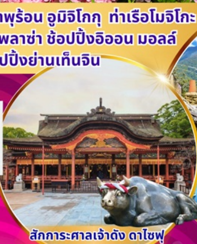
สักการะศาลเจ้าดัง ดาไซฟู