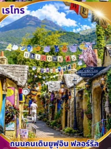
ถนนคนเดินยูฟูอิน ฟลอร์ริล

พักโรงแรม 3 ดาว ★★ ★ ฟรี ประกันอุบัติเหตุ บริการอาหารท้องถิ่น