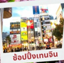
ช้อปปิ้งเทนจิน