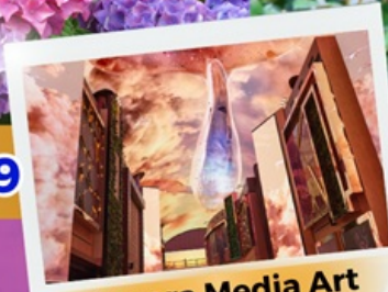
Aurora Media Art