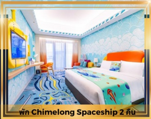
พัก Chimelong Spaceship 2 คืน

ช้อปปิ้งเดอะเวเนเชียน The Parisian The Londoner