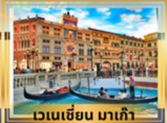
เวเนเชียน มาเก๊า