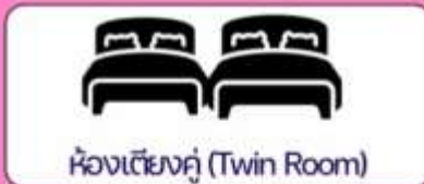
ห้องเตียงคู่ (Twin Room)