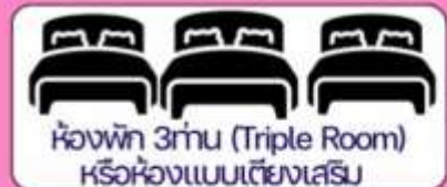
ห้องพัก 3 ท่าน (Triple Room) หรือห้องแบบเตียงเสริม

กรณีพัก 3 ท่านถ้าวันที่เข้าพักโรงแรม ไม่มีห้อง TRP (3 ท่าน) อาจจำเป็นต้องแยกพัก 2 ห้อง (มีค่าใช้จ่ายพักเดี่ยวเพิ่ม) กรณีห้อง TWIN BED (เตียงเดี่ยว 2 เตียง) ซึ่งโรงแรมไม่มีหรือเต็ม ทางบริษัทขอปรับเป็นห้อง DOUBLE BED แทนโดยมีต้องแจ้งให้ทราบล่วงหน้า หรือ หากต้องการห้องพักแบบ DOUBLE BED (1 เตียงใหญ่) ซึ่งโรงแรมไม่มีหรือเต็ม ทางบริษัทขอปรับเป็นห้อง TWIN BED แทนโดยมีต้องแจ้งให้ทราบล่วงหน้า กรณีห้องพักในเมืองที่ระบุไว้ในโปรแกรมมีเทศกาลวันหยุดยาว มีงานประชุมหรืองานแฟร์ต่างๆ บริษัทขอจัดที่พักในเมืองใกล้เคียงแทน