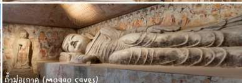
ถ้ำม่อเกาอู (Mogao caves)