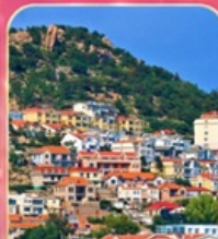
หมู่บ้านชาวประมงซาโจ่วโหว่