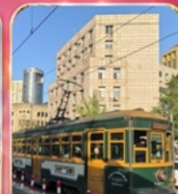
ขั้วรถรางไฟฟ้าชมเมือง