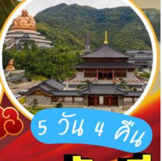
ภูเขาเสวียโต้วซาน