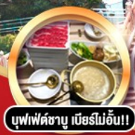
บุฟเฟ่ต์ชาบู เนิอร์โมอัน!!