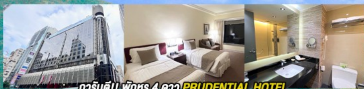
гаринดี!! พักทรู 4 ดาว PRUDENTIAL HOTEL ติดถนนนาธาน ย่านช้อปปิ้งจิมซาจู้