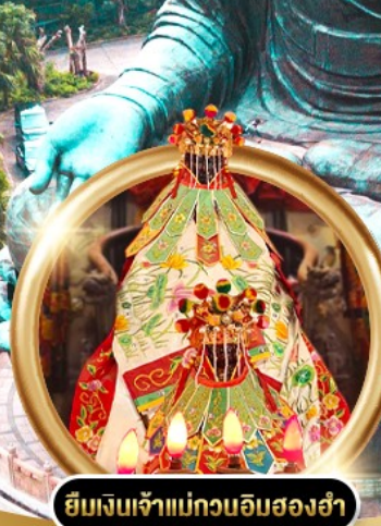
ขี้มเงินเจ้าแม่กวนอิมสองฮา