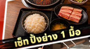
เช็ก ปิ้งย่าง 1 มื้อ