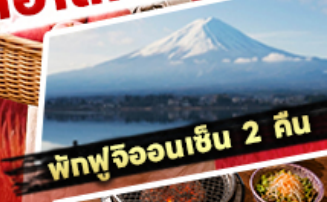
พิชฟุจิออนเซ็น 2 ถิ่น