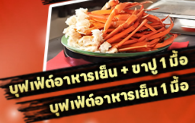
บุฟเฟ่ต์อาหารเย็น + ชาปู 1 มื้อ บุฟเฟ่ต์อาหารเย็น 1 มื้อ