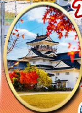
Mikimoto Pearl Island Amaharashi Coast Toyama Castle