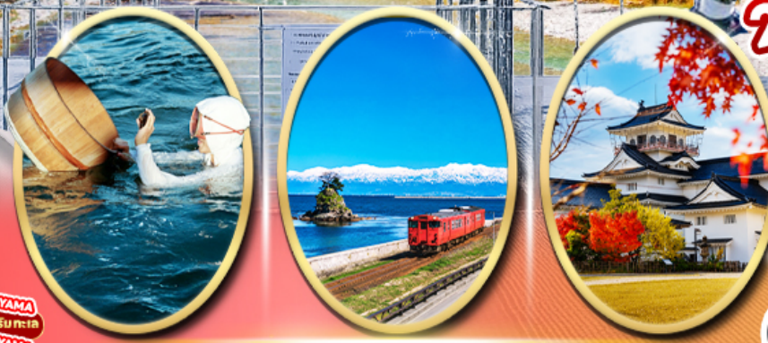
Mikimoto Pearl Island Amaharashi Coast Toyama Castle