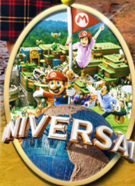
อิสระเลือกซื้อบัตร Universal Studios Japan