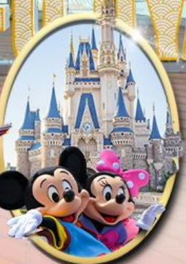
อิสระเลือกซื้อบัตร Tokyo Disneyland