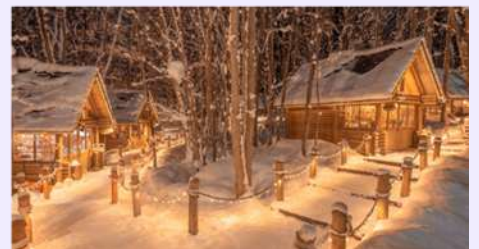
รูปภาพใช้ประกอบการโฆษณาเท่านั้น