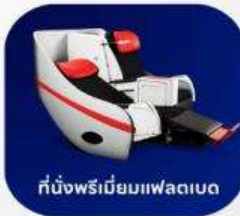
ที่นั่งพรีเมียมแฟลตเบด