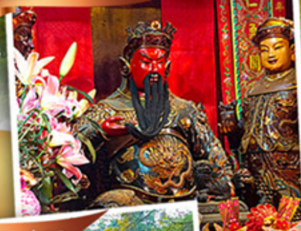
วัดหลินฟ้าทอง