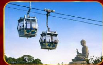
กระเช้านองปิง