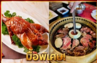
บิวเฟต์เปิดอย่างฮ่องกง บุปเฟ่ต์ปิ้งย่างเกาหลี