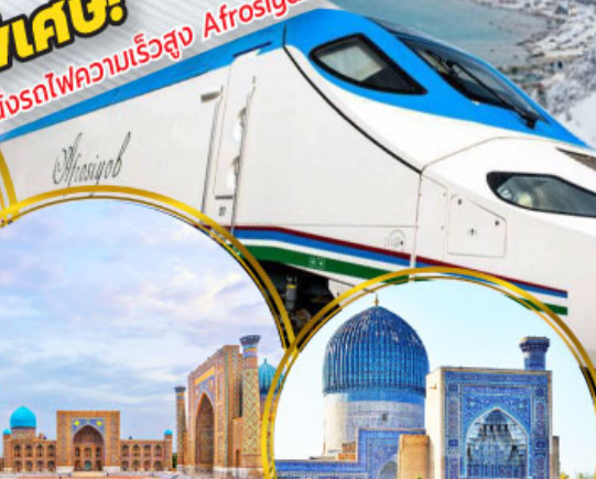
จัตุรัสเรจิสถาน