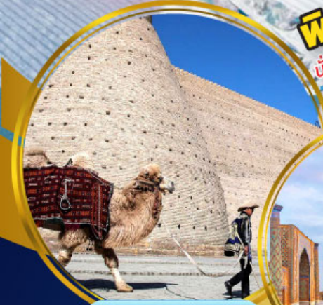
บ้อมปราทารบุคาร่า