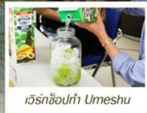
เวิร์กช็อปทำ Umeshu