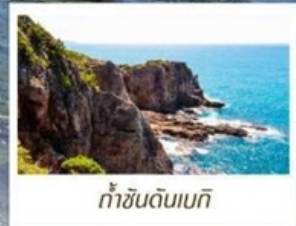
ท้ำซันดินเบทึ