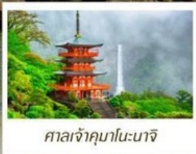
ศาลเจ้าคามาโมะนาจิ