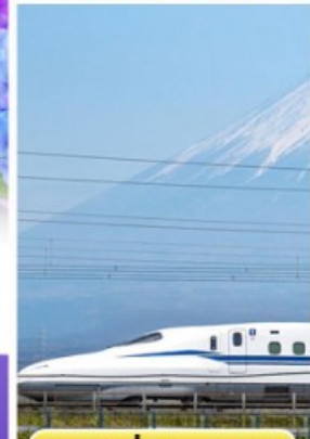
สัมปัสนั่งชินคันเซน