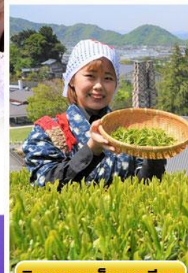
กิจกรรมเก็บชาเขียว