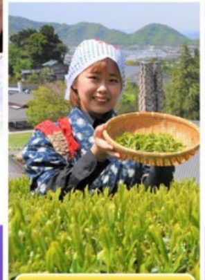
กิจกรรมเก็บชาเขียว