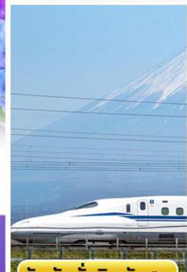
สัมผัสนั่งชินคันเซน