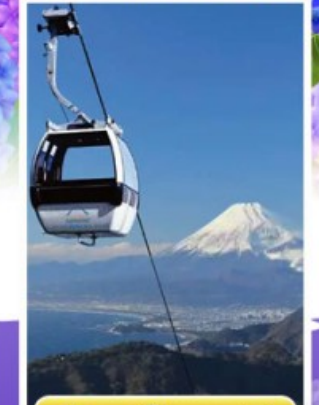
อีซูพานรามาวิว

ออนเซ็น 1 คั้น นน.กระเป๋า 23 กก. 7Days 4Night