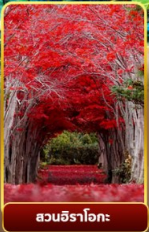
สวนอิราโอกะ