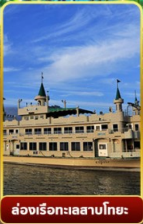
ล่องเรือทะเลสาบโทยะ