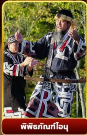
พิพิธภัณฑ์โอนู