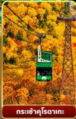
กระเช้าคุโรดากะ

ออนเซ็น 3 คั้น นน.กระเป๋า 23 กก. 7Days 5Night