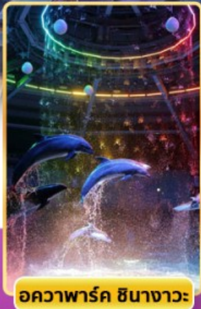
อควาพาร์ค ซินางาวะ