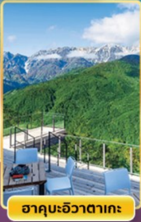
ฮาคุบะฮิวาตากะ