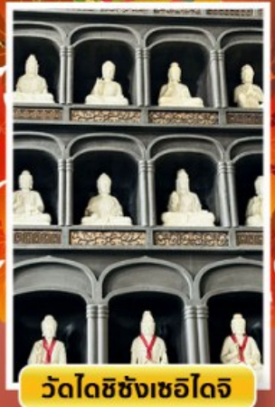
วัดโดชิซังเซโอดิจิ