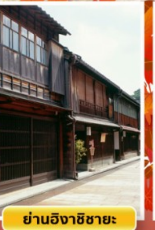
ย่านอิงาชิบายะ