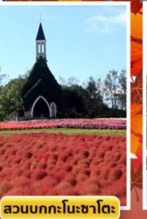
สวนบกกะโนะซาโตะ