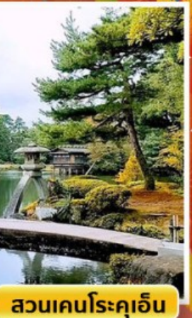
สวนเคนโรคุเอ็น

🌫️ ออนเซ็น 3 คั้น 🧳 นน.กระเป๋า 23 กก. ☀️ 7Days 5Night