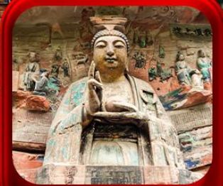
“ ผาคินแกะสลักต้าจู้ ”

บินตรงลงฉงชิ่ง • อุ้หลง หลุมฟ้าสะพานสวรรค์ • ระเบียบแกว่ • อุทยานเขานางฟ้า หงหยาดัง • นิ่งรถไฟกะลุดัก • ศาลาประชาม (ด้านนอก) • หลงหมินฮ่าว มรดกโลกผาคินแกะสลักต้าจู้ • วัดหลิวฮั่น • ตึกตะเกียบ • หมู่บ้านโบราณซือซีไจว่