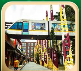
“ตงเจียวจี้”