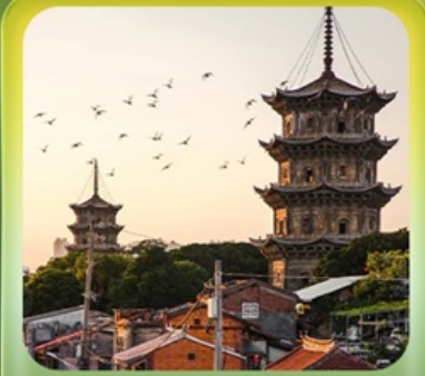
“เมืองโบราณฉวนโจว”