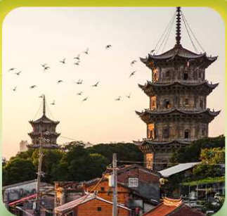
“เมืองโบราณฉวนโจ้ว”