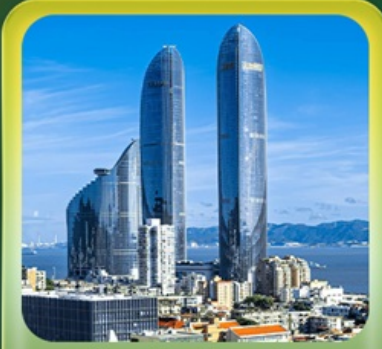
“ตึกแฝดเซี่ยเหมิน”