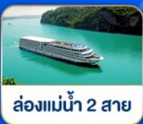
ส่องแม่น้ำ 2 สาย