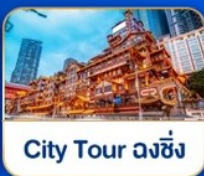
City Tour ดงซิง