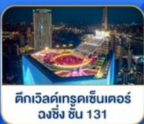
ดิถวิลด์เทรดเซ็นเตอร์ ดงซิง ชั้น 131