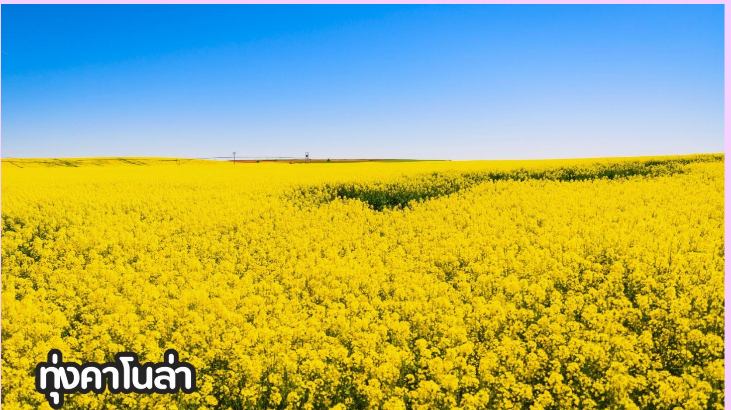
ทุ่งคาโนล่า

ที่พัก Holiday Inn Express หรือเทียบเท่าระดับ 4 ดาวจีน