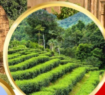
ไร่ชาอัสสัม