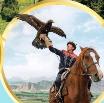
ชมโซว์นกอินทรี