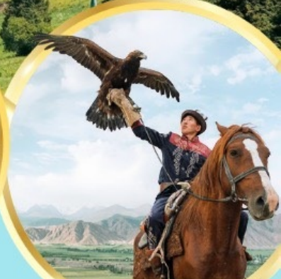
ชมโซว์นกอินทรี