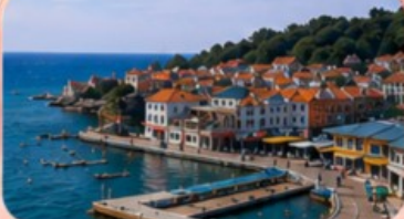
หมู่บ้านชาวประมงซาจื่อไซ่