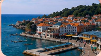
หมู่บ้านชาวประมงซาจ้อไซ่ว