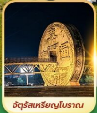
จัตุรัสเหรียญโบราณ