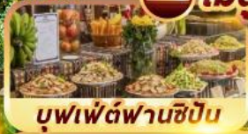
บุฟเฟ่ต์ฟานซีปัน