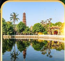
วัดเงินทิวก