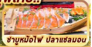
ซาบูหมือไฟ ปลาแซลมอน