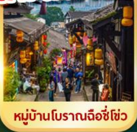
หมู่บ้านโบราณเฉิงชิว