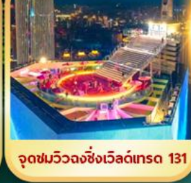
จุดชมวิวจางชิ่งเวิลด์เทรด 131