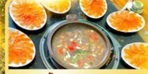
สุกี้ปลาแซลมอน