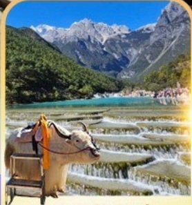
ทะเลสาบปิสู่ยเหอ