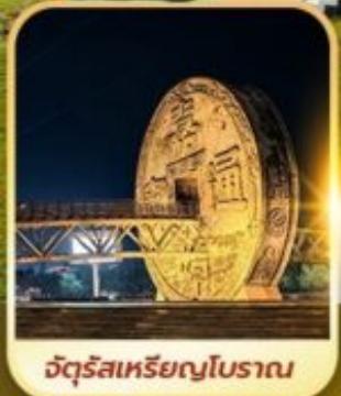
จัตุรัสเหรียญโบราณ