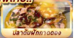
ปลาต้มพริกทอดดอง