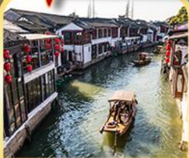
เมืองโบราณจูเจียเจี๋ย