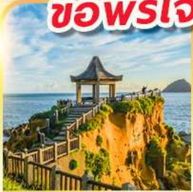
เกาะเหอผิง

พักย่านซีเหมินติง 2 คืน ขอพรเจ้าแม่กวนอิมพันมือ