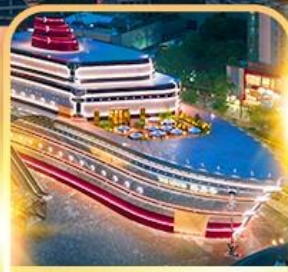
เรือ The LOUIS