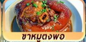
ชาหมูตงพอ