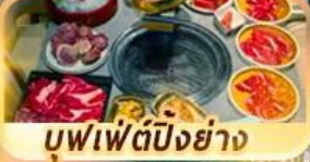
บุฟเฟ่ต์ปักกิ่งย่าง