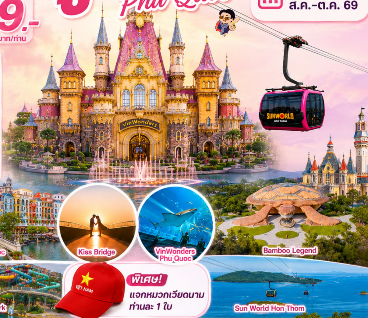
Venice Phu Quoc