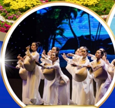
Charming Danang Show