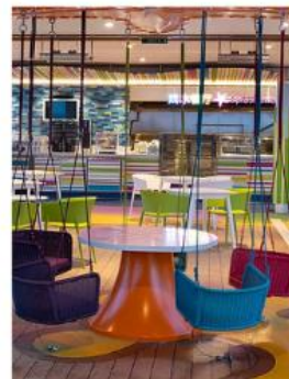
Splashaway Cafe SPLASHAWAY CAFE