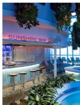
Sunshine Bar SUNSHINE BAR