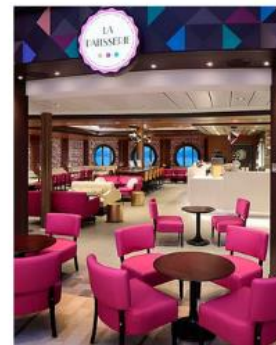
La Patisserie LA PATISSERIE