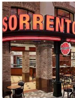
Sorrento's Pizza SORRENTO'S PIZZA