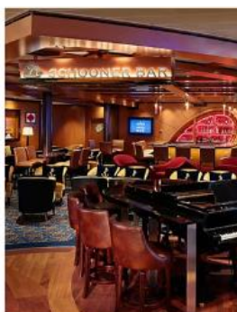
Schooner Bar SCHOONER BAR