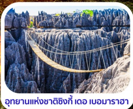
อุทยานแห่งชาติซิงกี เดอ เบอมารอา